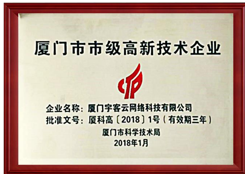
厦门市高新技术企业