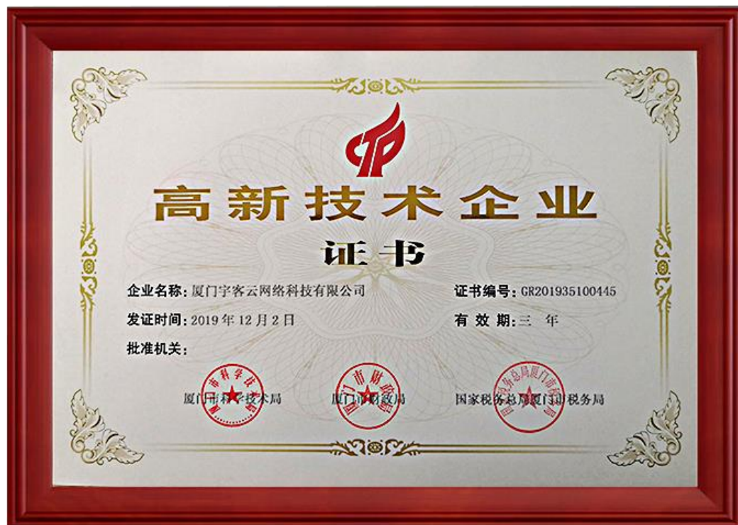
国家级高新技术企业