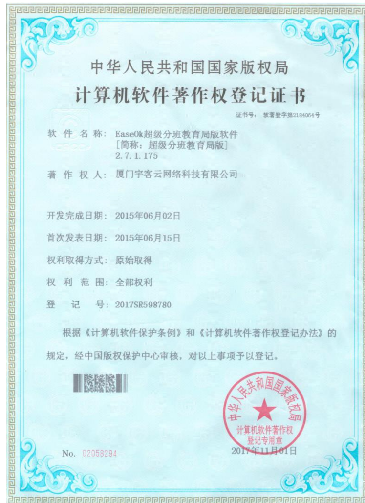
Easeok超级分班教育局版