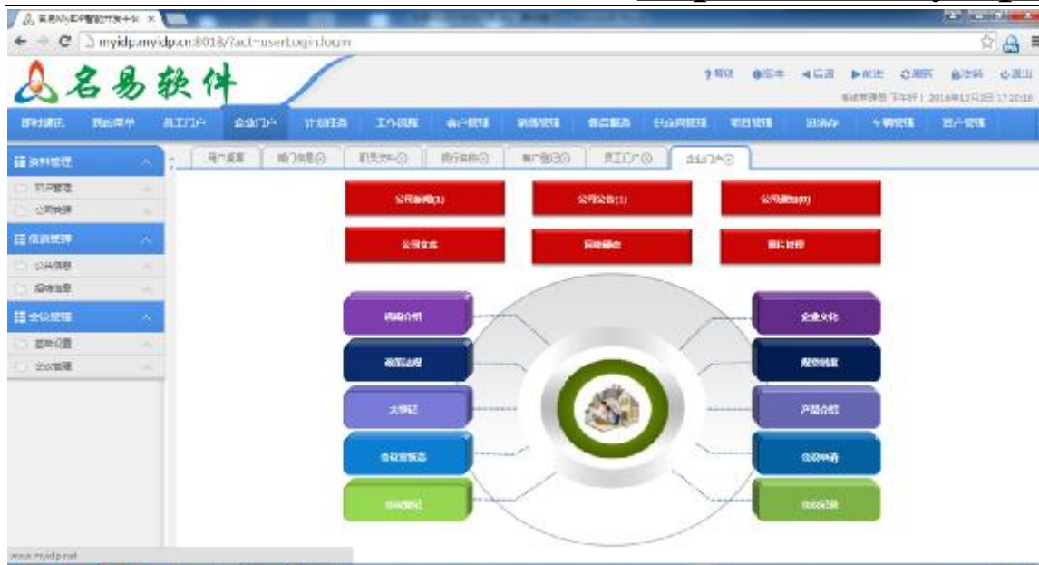
企业门户操作界面导航