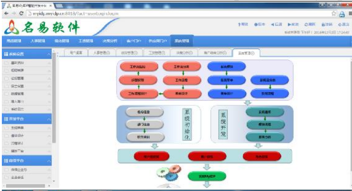
系统管理，二次开发操作界面导航