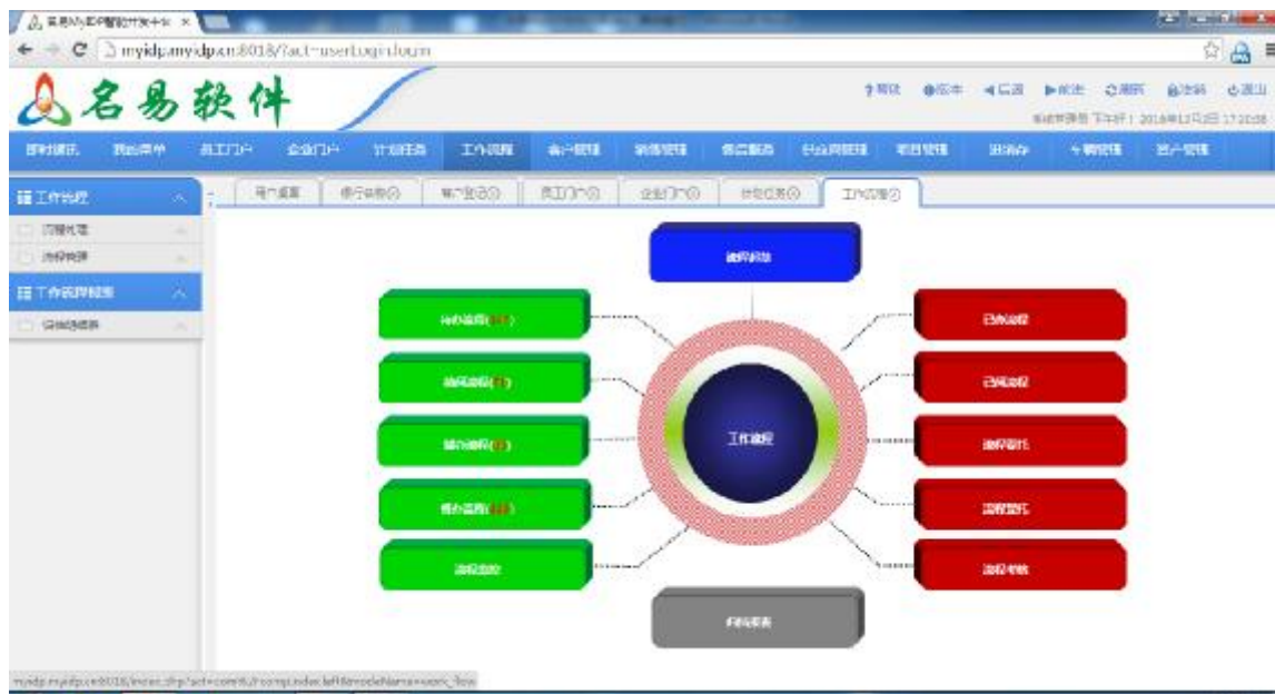
工作流程操作界面导航