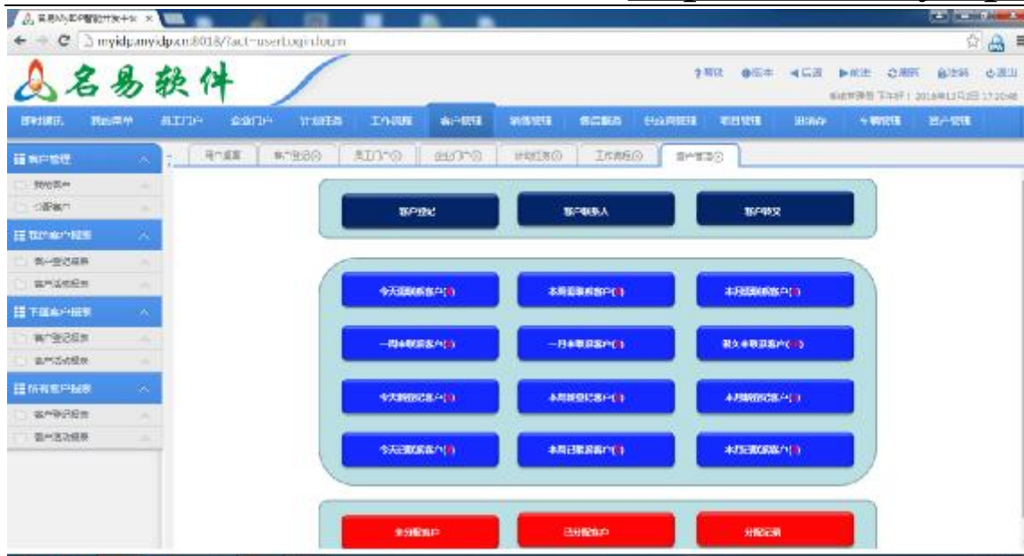
客户管理操作界面导航